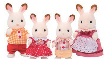
シルバニアファミリーホームページより

実は…私も子供の頃は「お人形さん遊び」が好きでした。母が女の子を欲しかったらしく、私に当時流行していた「シルバニアファミリー」を買い与えたためです。今でこそ男臭い顔に育った私ですが、30年くらい前はお人形に布団をかけて一緒に寝ていた過去があるのです(笑)