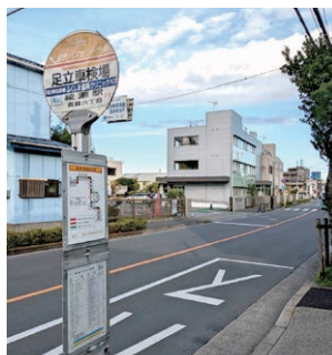
最寄りのバス停「足立車検場」