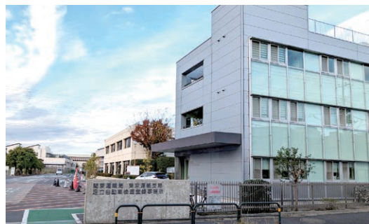
東京支店は足立自動車検査登録事務所の目の前