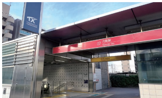
つくばエクスプレス六町駅からバスで7分