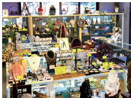
箱根水晶みやびHPより

ルチルクォーツ購入から約1カ月半……。実はぞくぞくと新しいご縁をいただいております。ルチルクォーツの力……。信じるか信じないかはあなた次第です!