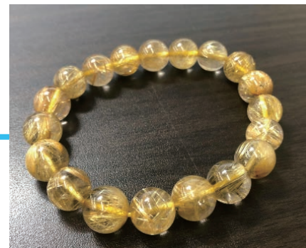
購入したルチルクォーツの数珠