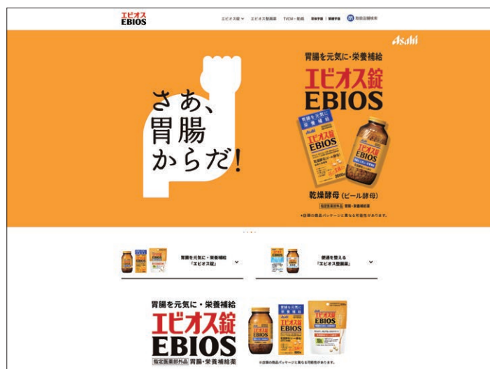
アサヒグループ食品 エビオス HP https://www.asahi-gf.co.jp/special/ebios/

この情報が、ウイルス性胃腸炎に悩む、隠れウイルス性胃腸炎被害者の一助となれば幸いです(笑)